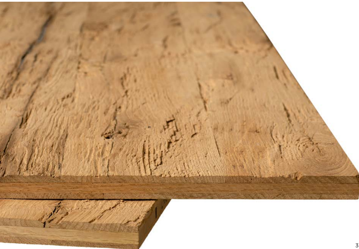
3-Schichtplatte, Blockwand Eiche Mittelware