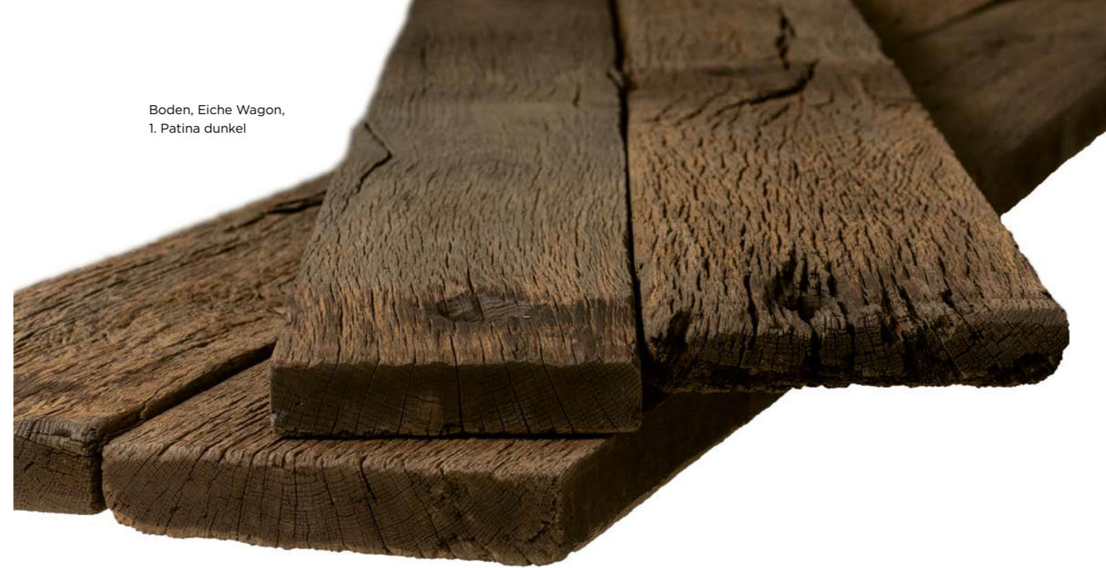
Boden, Eiche Wagon, 1. Patina dunkel