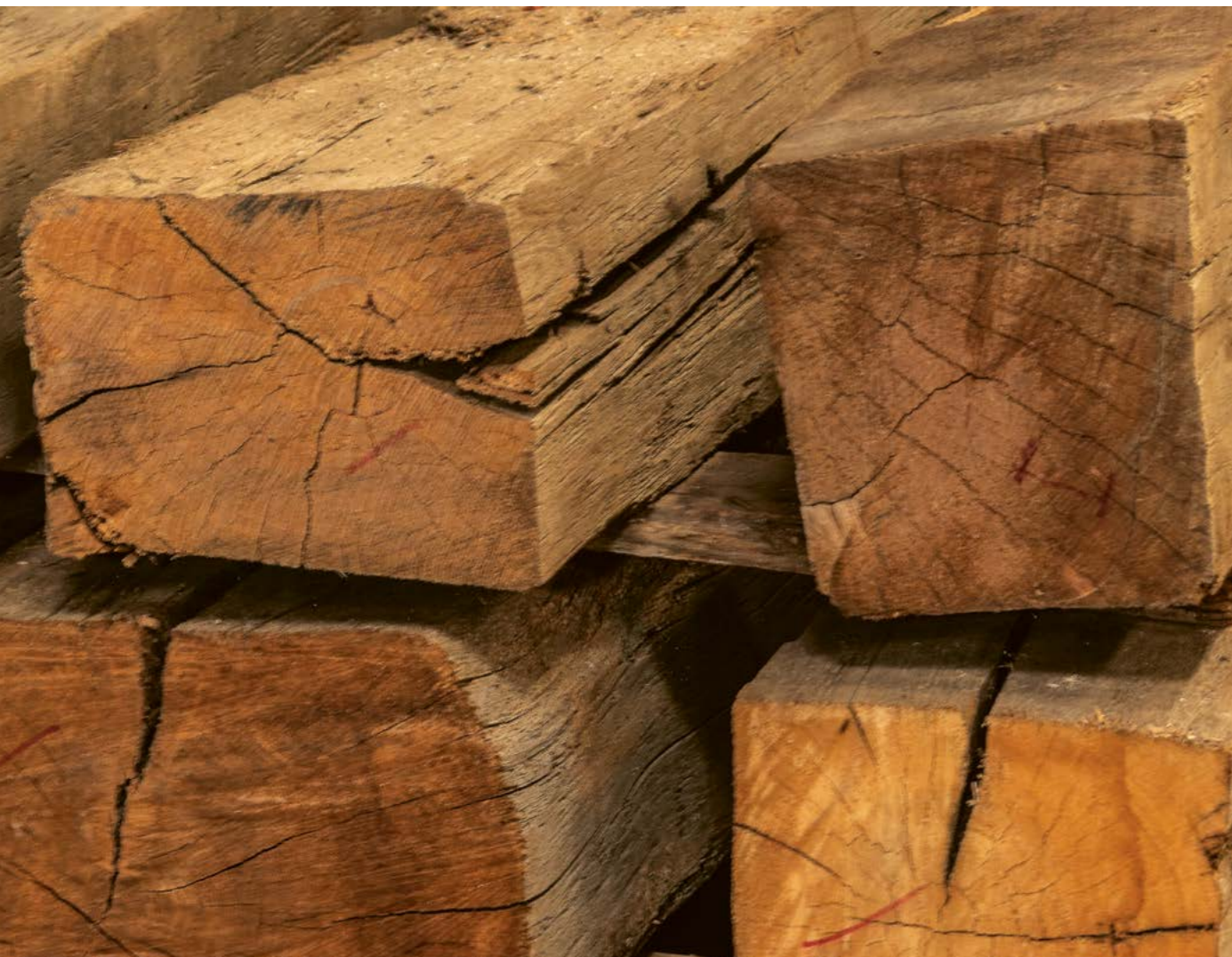
Alte Eichen-Balken, 1. Patina handbehauen, getrocknet