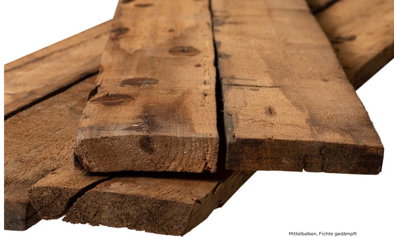
Mittelbalken, Fichte gedämpft 2. Patina von alten Balken geschnitten