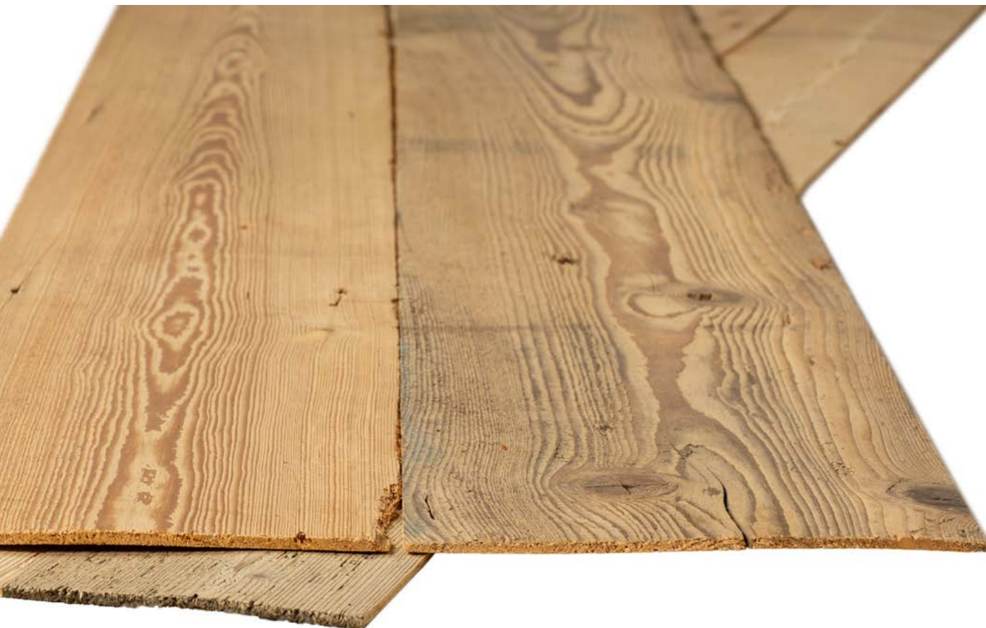
Lamelle, Fichte, 1. Patina Boden gebürstet