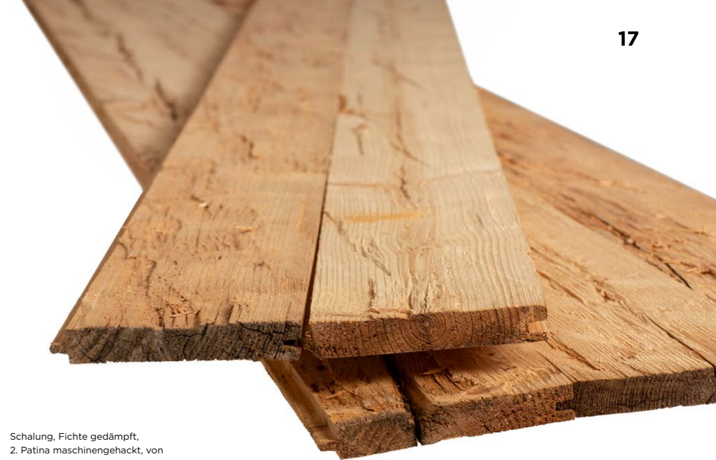
Schalung, Fichte gedämpft, 2. Patina maschinengehackt, von alten Balken geschnitten N+K