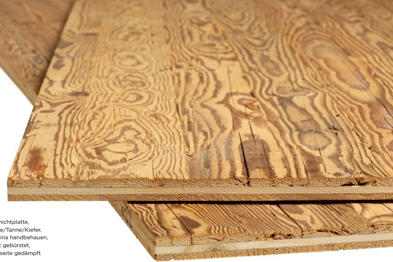
3-Schichtplatte, Fichte/Tanne/Kiefer, 1. Patina handbehauen, leicht gebürstet, Rückseite gedämpft