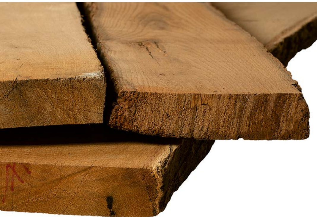
Mittelbalken, Eiche, 2. Patina von alten Balken geschnitten