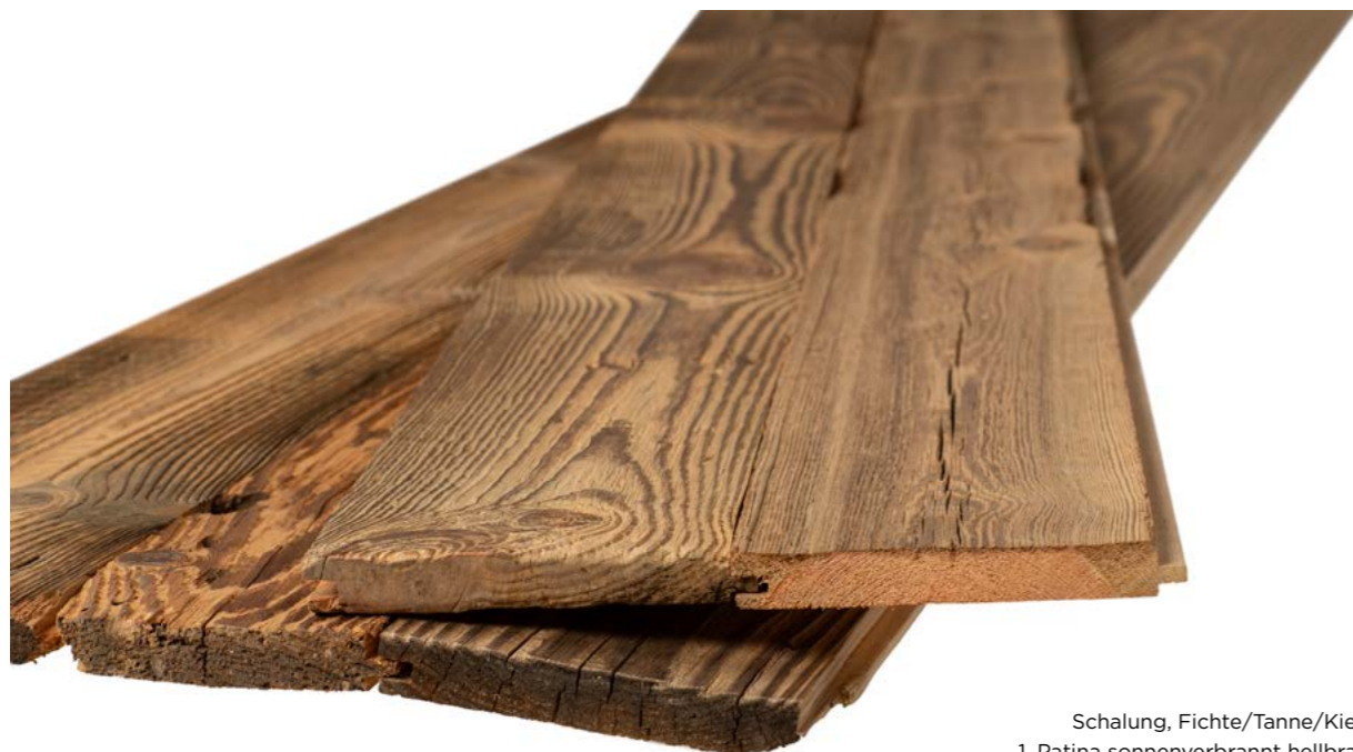
Schalung, Fichte/Tanne/Kiefer, 1. Patina sonnenverbrannt hellbraun, gebürstet N+K, Breite in Fixbreiten